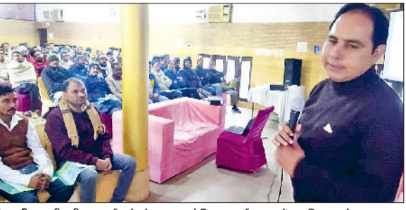
भिवानी। पानी की सफाई को लेकर आयोजित कार्यशाला में उपस्थित लोग व मुख्य वक्ता।