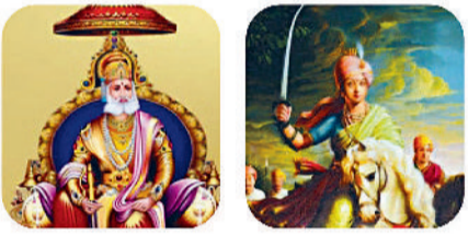
महाराज अग्रसेन रानी लक्ष्मीबाई