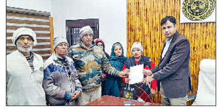
भिवानी। वेतन की मांग को लेकर ज्ञान सौंपते हुए।

भवन बनाए जाने का बजट नहीं पहुंचा है। हालांकि कुछ स्कूलों के भवनों का निर्माण शुरू करवाए जाने का बजट जारी भी हो चुका है, लेकिन जिन स्कूलों का बजट जारी नहीं हो पाया है। उन स्कूल के शिक्षकों व विद्यार्थियों के लिए बड़ी समस्या बनी है।