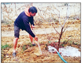
भिवानी। कड़ाके टंड से बचाने के लिए पौधे की सिंचाई करते हुए।

नेताजी सुभाष चंद्र बोस युवा जागृत सेवा समिति के द्वारा पौधों के रखरखाव व उनके संरक्षण को लेकर इस वर्ष कोल्ड अटैक थीम पर जागरूकता अभियान के तहत लोगों से पेड़ पौधे बचाने व उनके संरक्षण की अपील की गई है। वन महोत्सव के तहत हरियाणा प्रदेश जिला मुख्यालयों पर कई लाख पौधे लगाए गए, अगर देश में बात की जाए तो करोड़ों पौधे पर्यावरण के संतुलन