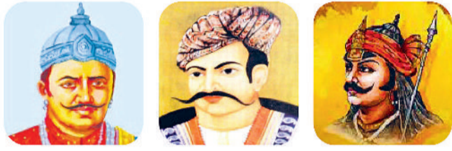
राजा नाहर सिंह राजा राव तुलाराम महाराणा प्रताप