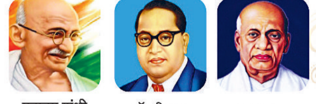
महात्मा गांधी डॉ. भीमराव अम्बेडकर सरदार वल्लभभाई पटेल

स्थान: नई अनाज मंडी, चरखी दादरी प्रीतिभोज : प्रातः 11:00 बजे से