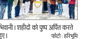
भिवानी। शहीदों को पुष्प अर्पित करते हुए।