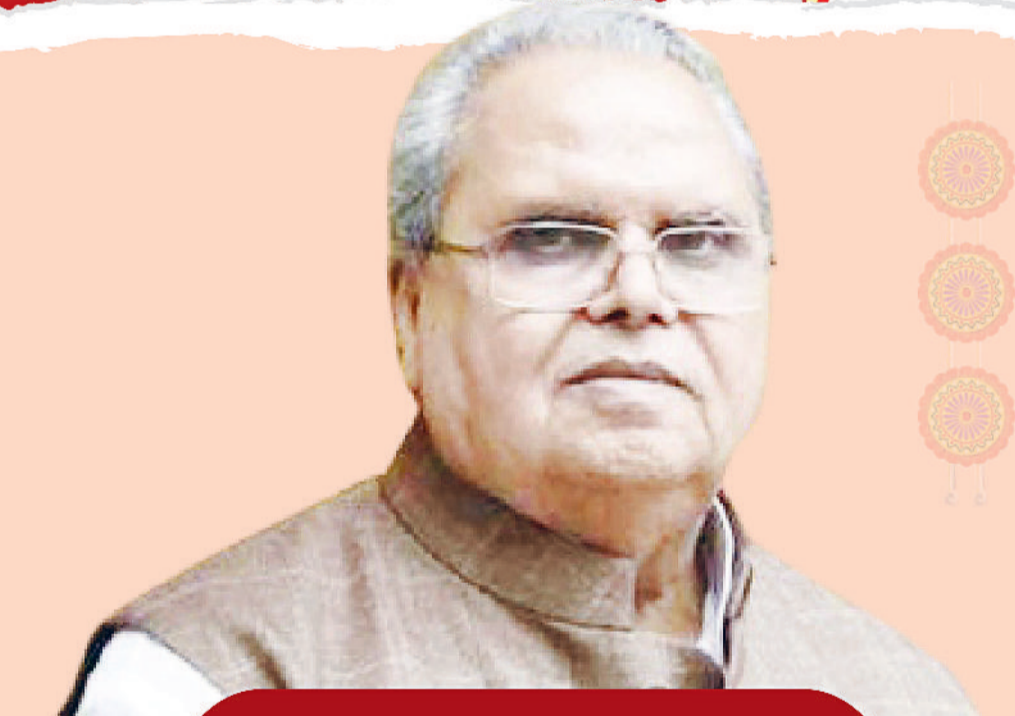
मुख्यातिथि माननीय श्री सत्य पाल सिंह मलिक प्रसिद्ध भारतीय राजनीतिज्ञ एवं पूर्व राज्यपाल- जम्मू कश्मीर, गोवा, बिहार एवं मेघालय