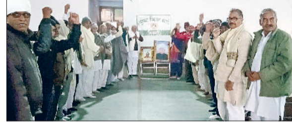
भिवानी। आयोजित कार्यक्रम में किसान मजदूर नेता चौधरी छोट्टाराम के चित्र पर पुष्प अर्पित करते हुए।

संयुक्त किसान मोर्चा व केन्द्रीय ट्रेड यूनियनों ने किसान मजदूर नेता चौधरी छोट्टाराम की 78 वीं पुण्यतिथि तथा महाराजा नाहर सिंह का 165 वां शहादत दिवस मनाते हुए अपनी मांगों के लिए 10 जनवरी से 20 जनवरी तक जन अभियान तथा 26 जनवरी को जिला स्तर पर ट्रेक्टर व मोटर साईकिल मार्च निकालने का निर्णय लिया। संयुक्त किसान मोर्चा व केन्द्रीय ट्रेड यूनियनों की