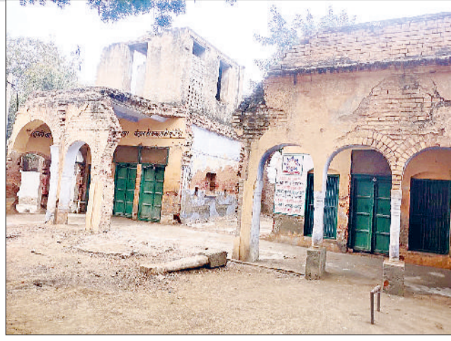
भिवानी। टूटे स्कूल भवन और मुख्य गेट का दृश्य।

मिवाणी ब्लॉक में इस तरह के स्कूलों की संख्या करीब आठ से दस तक। कुछ कमरों को तोड़ा गया है और उन कमरों में बैठने वाले बच्चों को दूसरी कक्षा के बच्चों के साथ बैठाया जा रहा है।