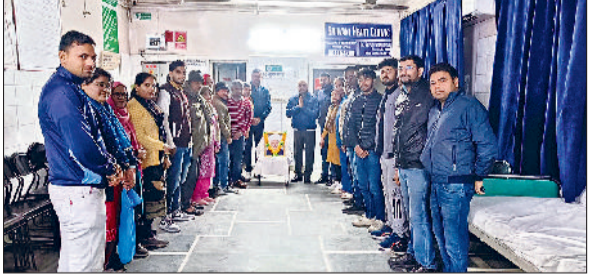
भिवानी। किसानों के मसीहा सर छोट्टाराम को याद करते हुए।

डीएपी खाद की किल्लत और कालाबाजारी से जूझ रहे हैं। उन्होंने खाद की आपूर्ति बढ़ाने की मांग उठाई है। बीजेपी-जेजेपी सरकार द्वारा कागजों में खाद के भंडार दिखाए जा रहे हैं। लेकिन वह किसानों तक नहीं पहुंच रहे। इससे स्पष्ट है कि खाद की कालाबाजारी हो रही है। प्रदेश के 22