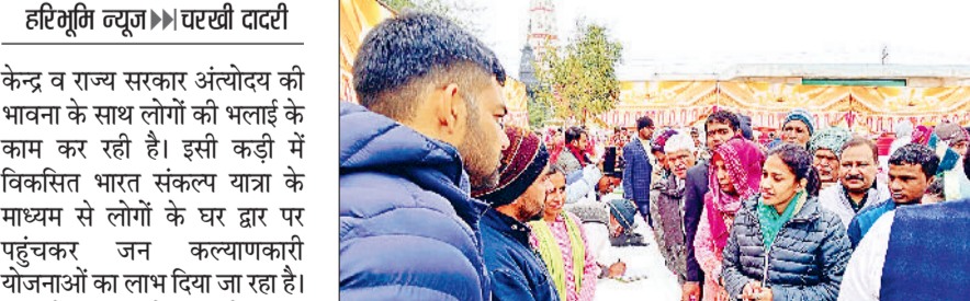
चरखी दादरी। स्टॉल का अवलोकन करते मुख्य अतिथि।

डीएपी खाद की किल्लत और कालाबाजारी से जूझ रहे हैं। उन्होंने खाद की आपूर्ति बढ़ाने की मांग उठाई है। बीजेपी-जेजेपी सरकार द्वारा कागजों में खाद के भंडार दिखाए जा रहे हैं। लेकिन वह किसानों तक नहीं पहुंच रहे। इससे स्पष्ट है कि खाद की कालाबाजारी हो रही है। प्रदेश के 22