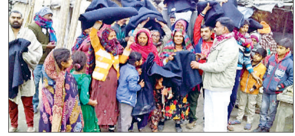
हरिभूमि न्यूज » भिवानी

समाज सेवा बढ़कर कोई पुण्य का कार्य नहीं: मड्डू