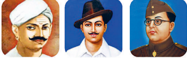
मंगलपाण्डे शहीद भगत सिंह सुभाष चन्द्र बोस