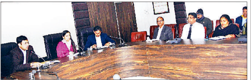
भिवानी। गणतंत्र दिवस को लेकर अधिकारियों को दिशा-निर्देश देती एडीसी।

समारोह कार्यक्रम स्थल पर रंगोली बनाई जाएगी उत्कृष्ट कार्य करने वाले होंगे सम्मानित