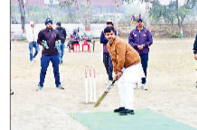
तोशाम। क्रिकेट प्रतियोगिता का शुभारंभ करवाते हुए।