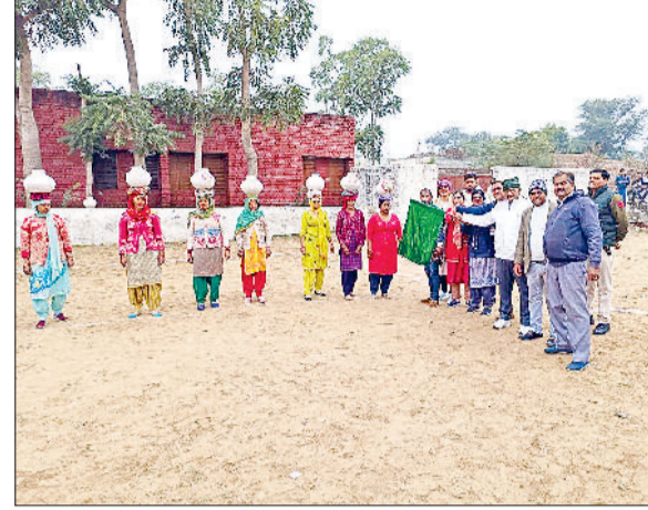
तोशाम। मटका दौड़ में भाग लेती प्रतिभागी व प्रतियोगिता में बेहतरीन प्रदर्शन करने वाले प्रतिभागियों को सम्मानित करते हुए।